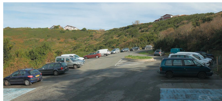
Avant travaux Site de l'ancien parking

Dans ma mission d'information estivale auprès des usagers, j'ai observé que pour certains riverains, la suppression d'espèces ornementales invasives (pittosporum) pour laisser place à la prairie littorale, avait suscité des oppositions.