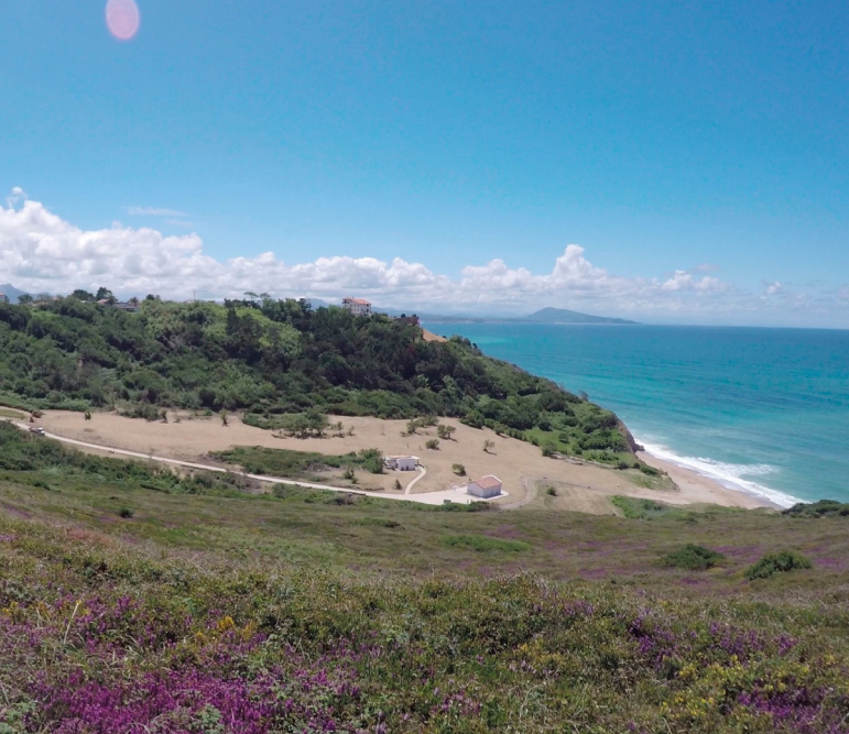
Panorama de la plage d'Erretegia (après travaux)